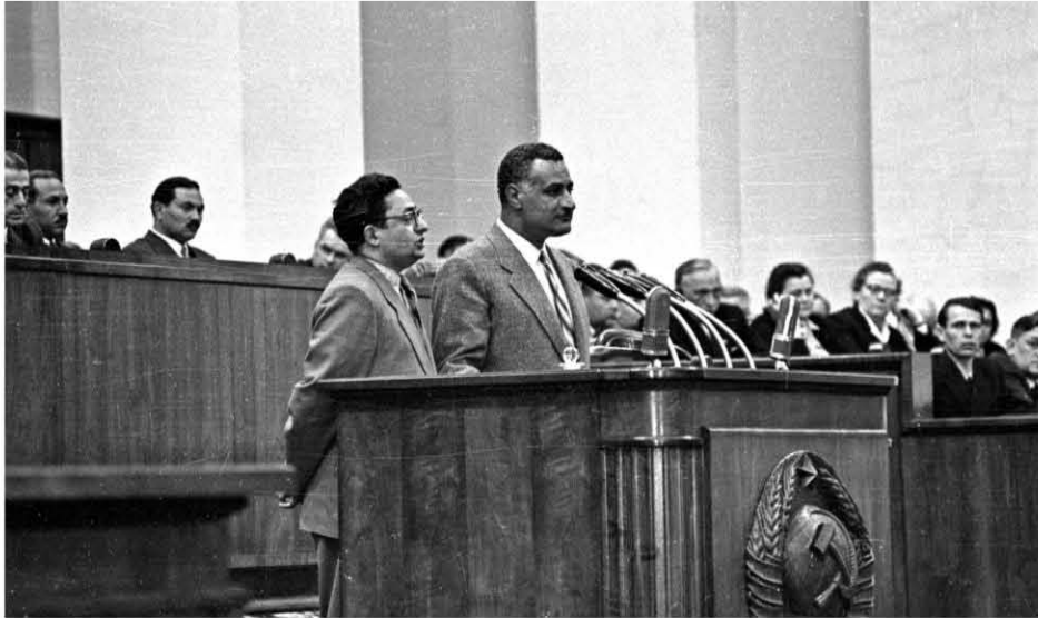
الرئيس جمال عبد الناصر يلقي كلمة في الكرملين أثناء زيارته للاتحاد السوفيتي ١٩٥٨/٥/٣

أعلن السيد نيكيتا خروشوف، في حفل الاستقبال الذي أقيم تكريماً للمشير عامر في الكرملين مساء اليوم، قرار الحكومة السوفيتية بالموافقة على تقديم قرض بمبلغ ٤٠٠ مليون روبل الى ج ع م؛ لتنفيذ المرحلة الأولى من السد العالي.